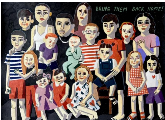
"Bring them back home! (The kidnapped children)", 2023

It took me a long time to really realize what had happened. It got bigger and bigger. New details are still coming out today. I then decided very quickly to go to Germany with my daughter for the time being, together with my niece and her young daughter. Only two years ago my niece fled from the Ukraine to Israel, when the war started there. And now it started again. She couldn't believe this was happening.