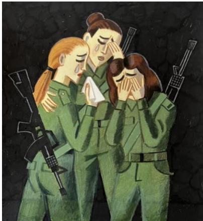
Zoya Cherkassky “Crying female soldiers. 7 Oct.2023”, 2023

Interview: Elke Buhr with Zoya Cherkassky – December 2023 Issue