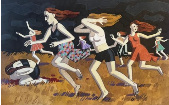
"The terrorist attack at Nova music festival", 2023

ZOYA CHERKASSKY, the Hamas attacks on Israel on October 7 was a moment when you knew immediately: This is drastic. How did you experience that day?