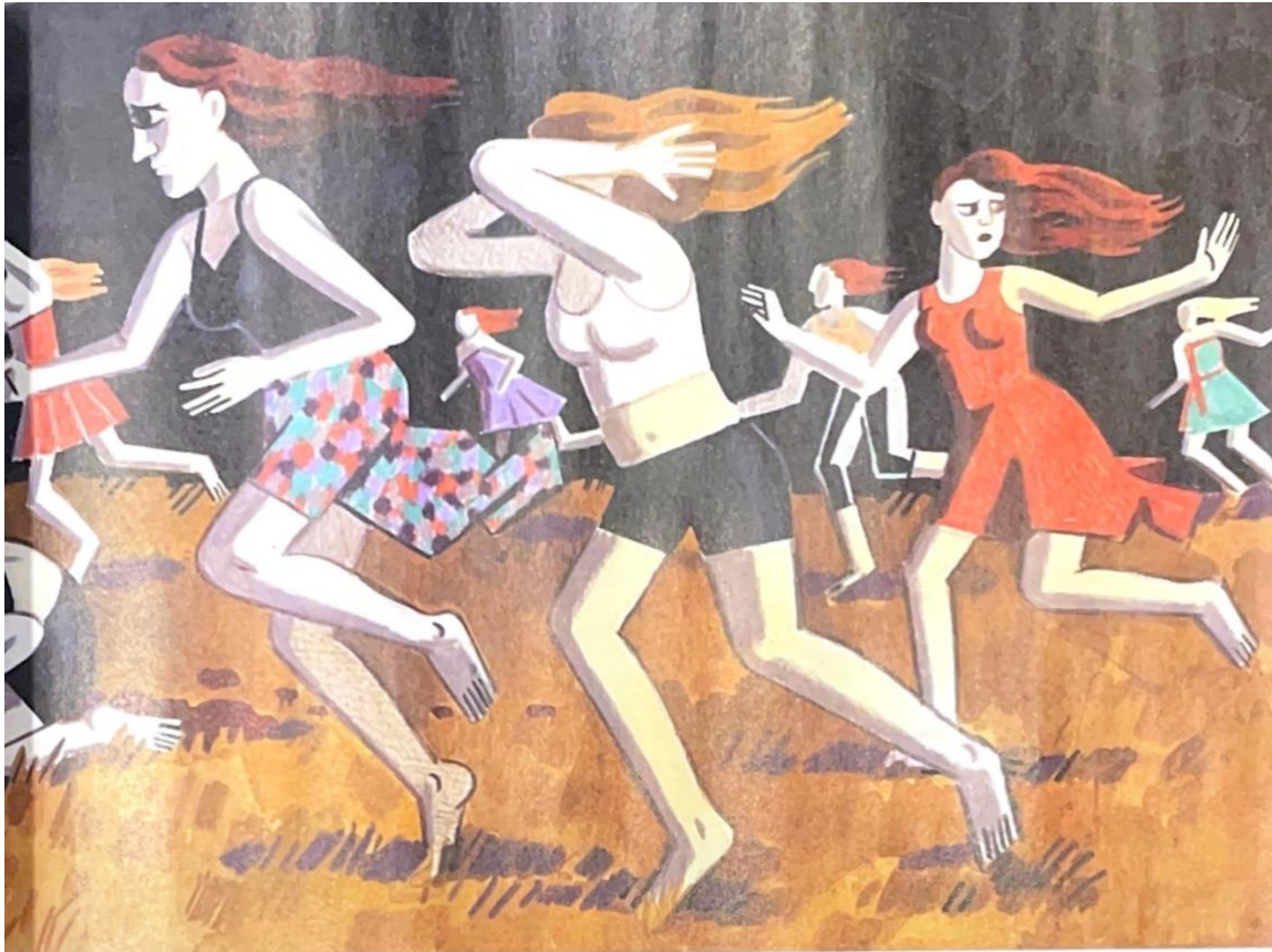
„The terrorist attack at Nova music festival“, 2023