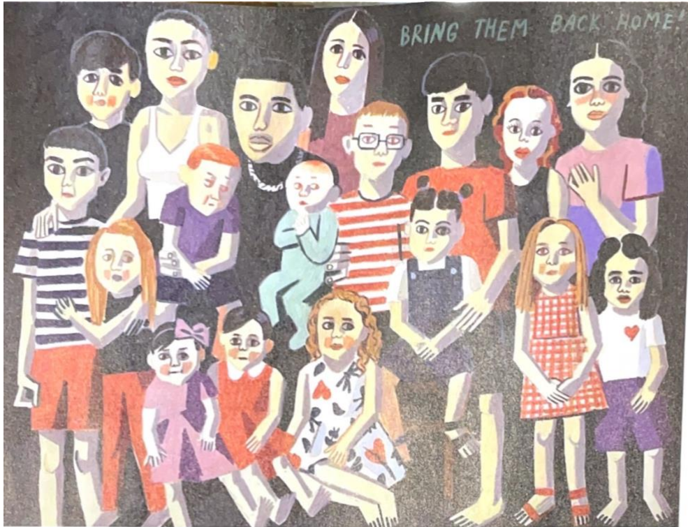
„BRING THEM BACK HOME! (The kidnapped children)“, 2023

Wann haben Sie begonnen, das Geschehen in Bildern zu verarbeiten?